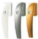
Roto Swing zamykací