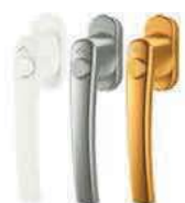
Roto Line s tlačítkem