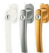
Roto Line zamykací