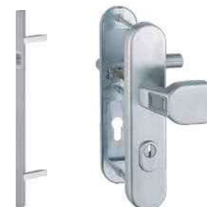
Madlo a klika s vestavěnou čtečkou otisku prstu

Zámek je určen pro automatické uzavření a otevření s možností mechanického otevření dveří pomocí kliky. V rámci možného příslušenství lze zámek ovládat přístupovými systémy typu: dálkový ovladač, kódová klávesnice, Bluetooth, snímač otisku prstů.