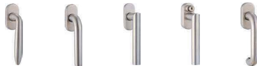
Nerezové modely okenních klik