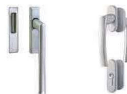
Kliky na balkonové dveře