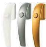
Roto Swing s tlačítkem